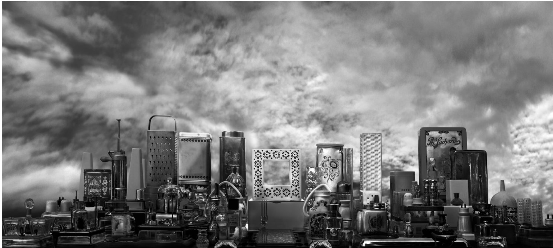
"Force majeure, Paris", 2023, på Galleri Flach.