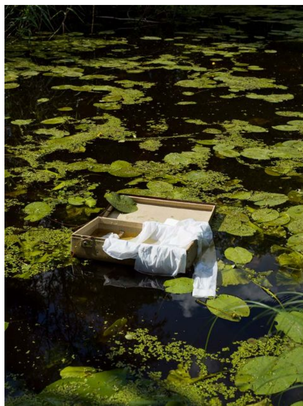
"Handed 2", 2022.